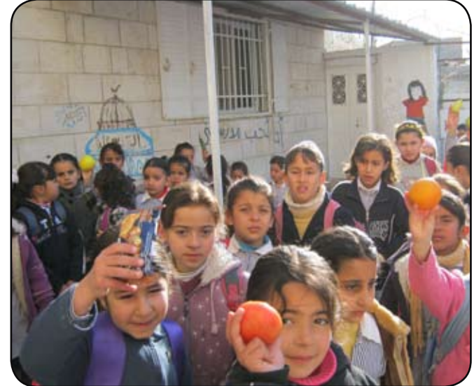
نشاط صحي عن فوائد الفاكهة