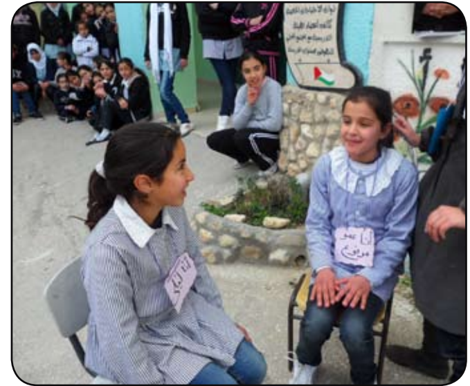
نشاط مسرحي ثقافي في "الإعراب"