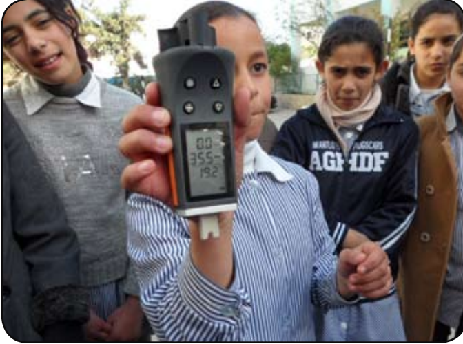
نشاط علمي حول قياس درجة حرارة الجو