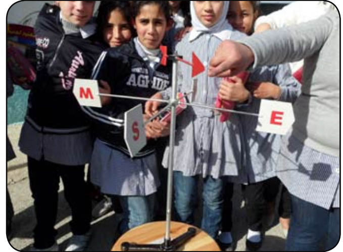
نشاط علمي حول حركة الرياح واتجاهاتها