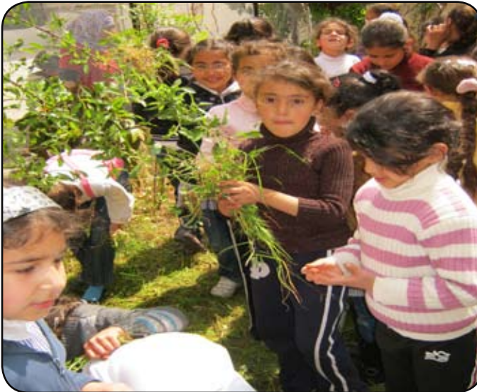
نشاط حول نظافة المدرسة