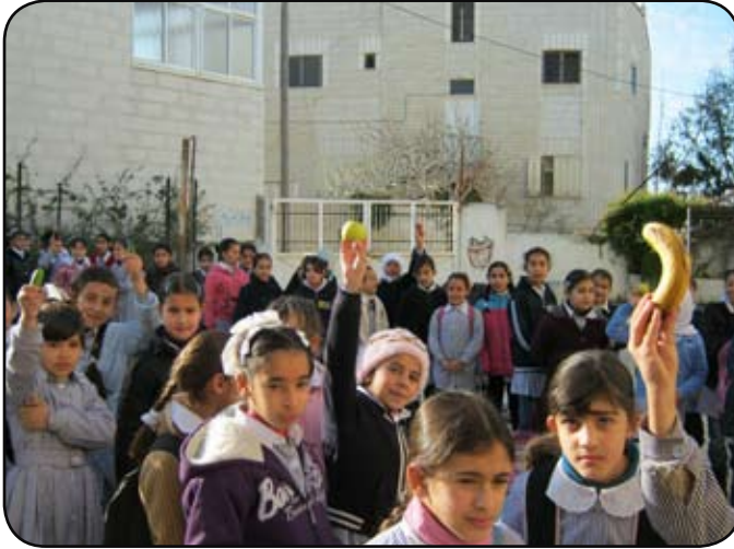
نشاط صحي عن فوائد الفاكهة