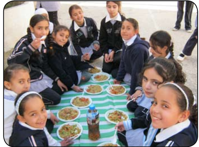
نشاط إفطار جماعي للطالبات