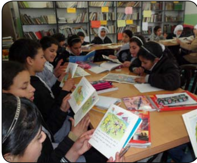
نشاط ثقافي في مكتبة المدرسة