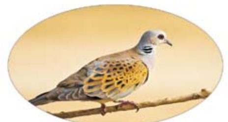
سجع : القمري