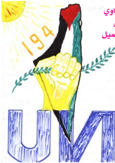
عبد الديرابي السادس مدرسة الجميل