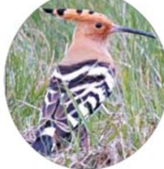
هدهدة : الهدهد