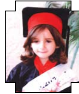
سدبل الخطيب - م. الخطيب / أم الشرايط