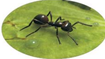
حفق / صرير: النملة