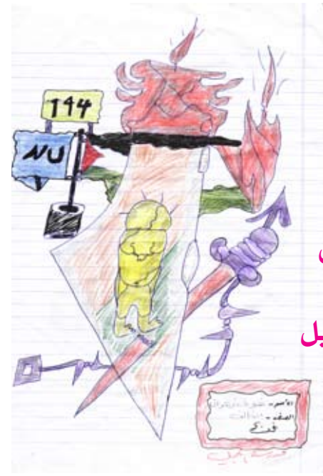
شوق زهران الثالث مدرسة الجميل