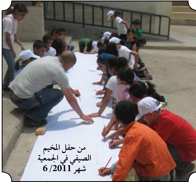
من حفل المخيم الصيفي في الجمعية شهر 6 / 2011

أحيانا أعز صديقاتك تذهب ولكن ليس بإرادتها، ولكن لا أحد يفرق بين الأصدقاء أبداً. الصديقة التي تحكي لها مشاكلك وهمومك وأسرارك الكبيرة، وهي أيضا تحكي لك أسرارها، ولكن مهما عبرنا عن المشاعر تبقى في قلبك الهم الأكبر، وعندما تذهب الصديقة الوفية يذهب الفرح كله والهموم تبقى في قلبك، ولكن أنت لا تخفي الهموم كلها في قلبك تبكي وتحكي همومك للورقة، لكنها سوف تبكي قبل أن تنزل دمعة من عينيك، فراق الأصدقاء صعب جدا، ولكن مهمى حاول الزمن أن يفرقنا عن بعضنا يبقى الصديق في القلب ولا يذهب، وإن صادقت مرة أخرى لن تحب الصديق مثلما أحببت الصديقة الوفية وهذه نهاية الصديقات الوفيات، الصديقة لا تعوض، الصداقة بئر يزداد عمقا كلما أخذت منه .