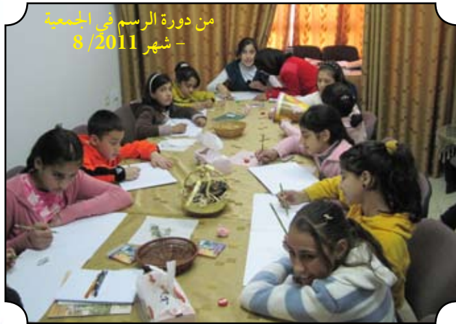
من دورة الرسم في الجمعية - شهر 8 / 2011

جاءت وأسعدتنا بعبيرها الفواح ، رحلت مثل نسمة عابرة وتركت ذكريات لا تنسى ، كانت مثل زخات المطر التي تأتي وتجف بسرعة ، وتترك خلفها الدفء .